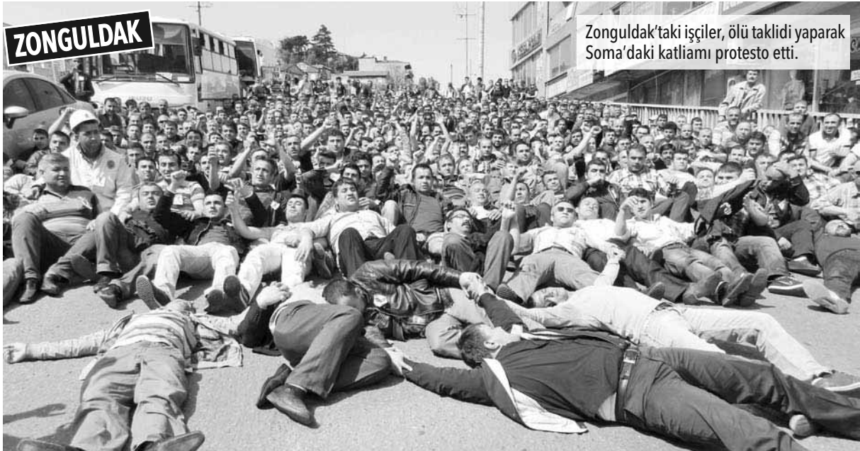
Zonguldak'taki işçiler, ölü taklidi yaparak Soma'daki katliamı protesto etti.