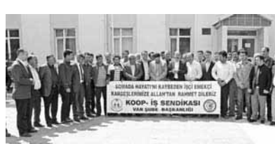
saygı duruşunda bulunan işçiler, ölen işçiler için dua okudu.

Van İl Millî Eğitim Müdürlüğü'nde çalışan Koop-İş Sendikası üyesi işçiler de Soma'da maden ocağında hayatlarını kaybeden işçi arkadaşları için 1 günlük iş bıraktı. İşyeri önünde 1 dakikalık