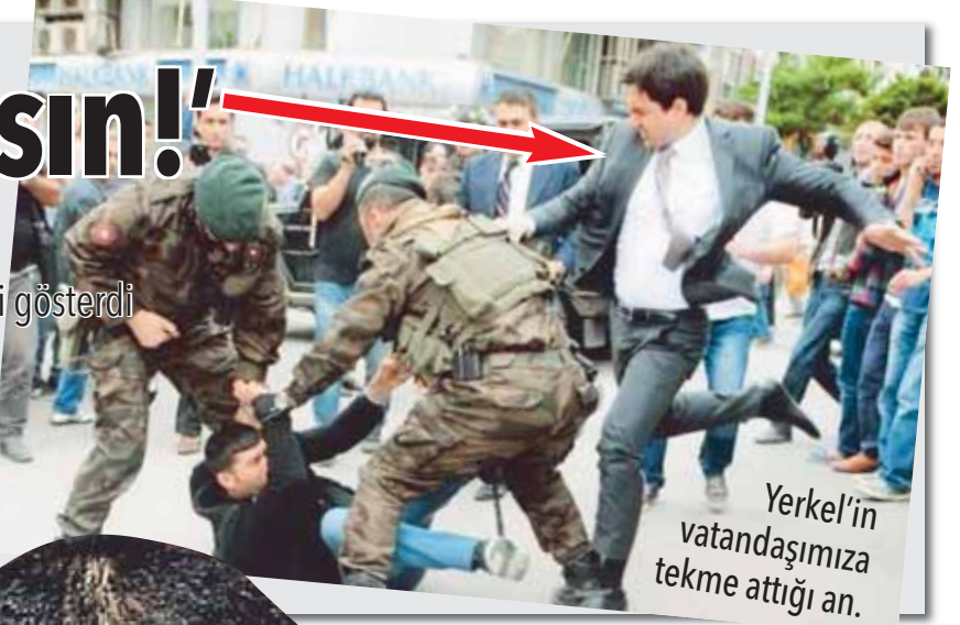
Yerke'ın vatandaşımıza tekme attığı an.

Hırvat basketbolcu Misura'nın bu mesajı kısa sürede gündem olurken, Twitter'da Türk kullanıcılardan kendisine büyük destek geldi. Yerke'ın bu mesajına ne cevap vereceği ise merak konusu.