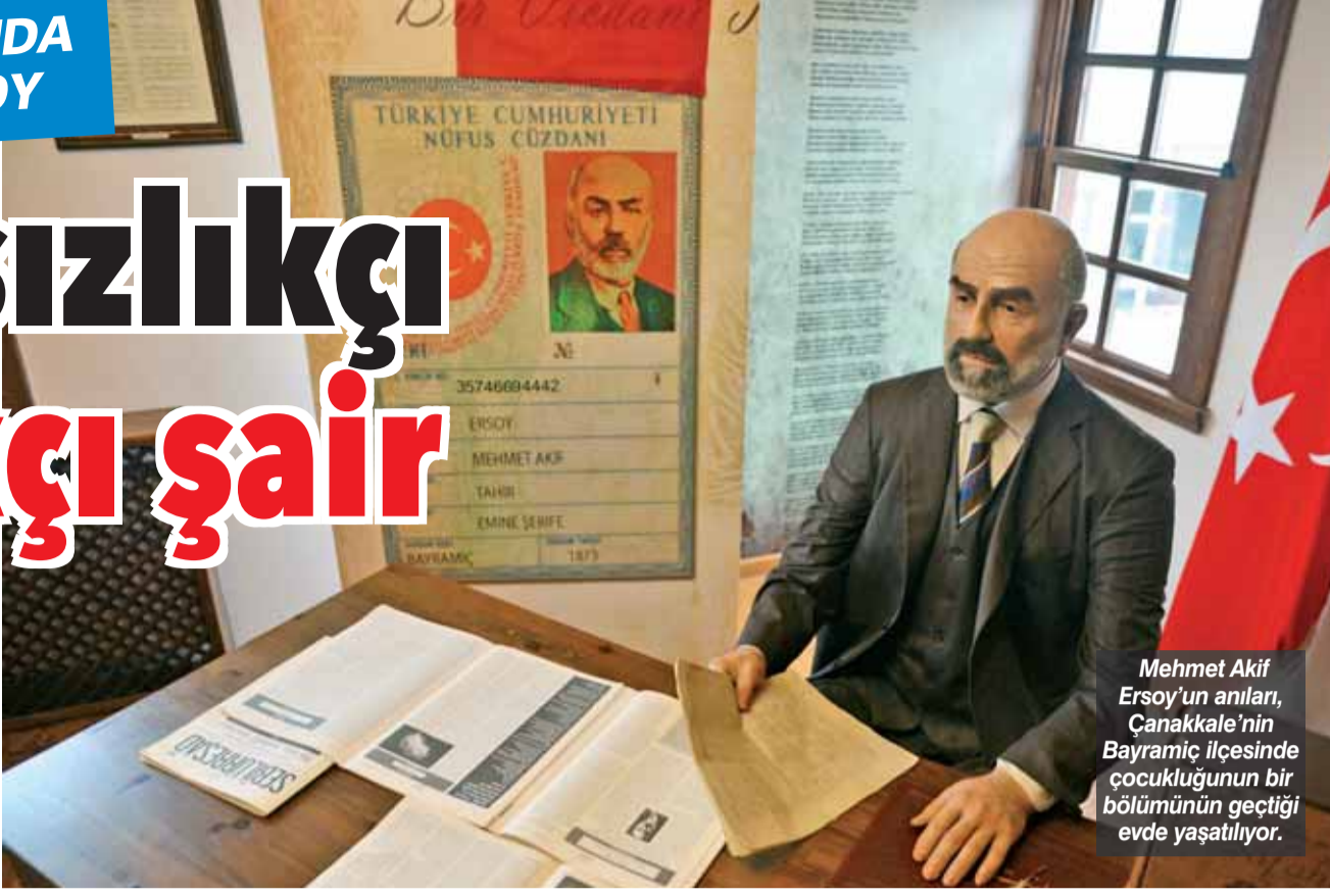
Mehmet Akif Ersoy'un anıları, Çanakkale'nin Bayramiç ilçesinde çocukluğunun bir bölümünün geçtiği evde yaşatılıyor.

Savaşlar, yoksulluklar, yıkılma ve yeniden var olmanın tozu dumani içinde, yapıtlarında 'halkı aydınlatma ideali' ağır basmıştır. Bugünün aydınlarının Mehmet Akif'ten bağımsızlık ve halkçılık konusunda alacağı çok ders var!